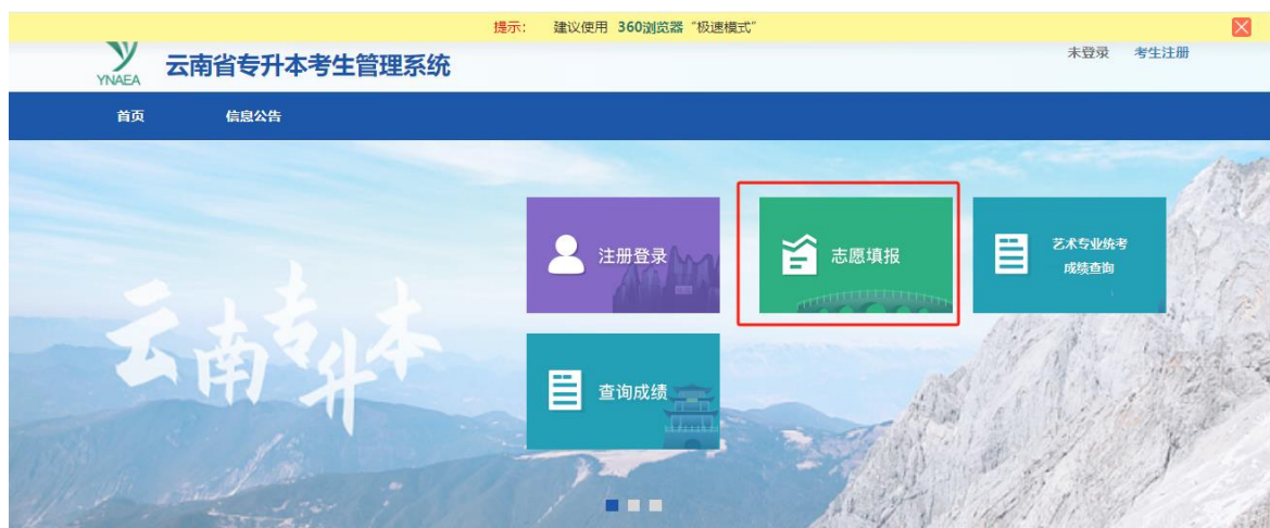
图 1 首页

进入网址后，点击图 1 页面中【志愿填报】按钮后，进入到登录页面，如图 2，按照要求填写。志愿填报时请使用电脑端进行网上填报志愿，不要使用手机等移动终端填报。