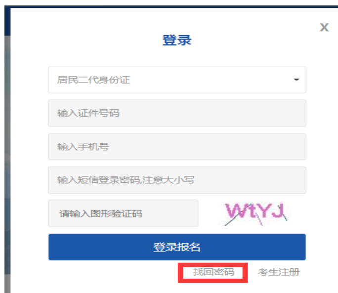
图 10 报名登录页面

报页面（图 11）点击【找回密码】，输入证件号、手机号找回密码，密码发送到手机中，如图 12。