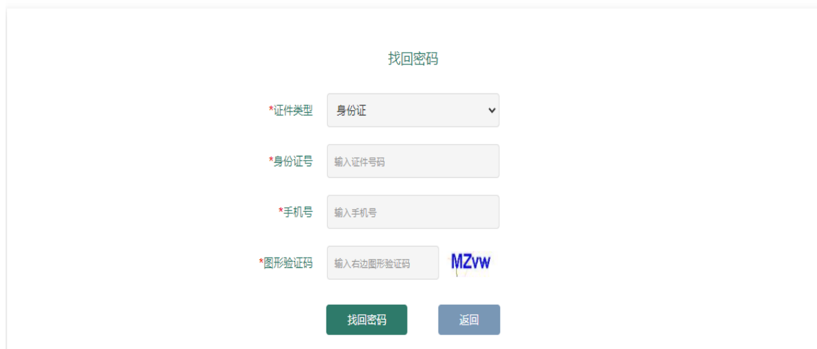
图 12 找回密码页面

找回密码 提示：若发送2次或长时间接收不到短信，请先稍等片刻直到收到短信（通讯正常后）再重试，短信有可能被手机上的拦截软件所拦截，请注意。