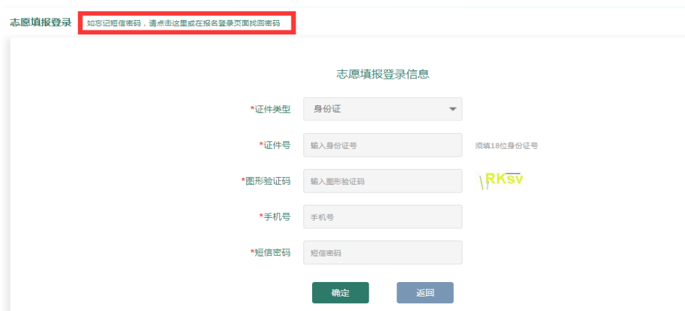
图 11 志愿填报页面