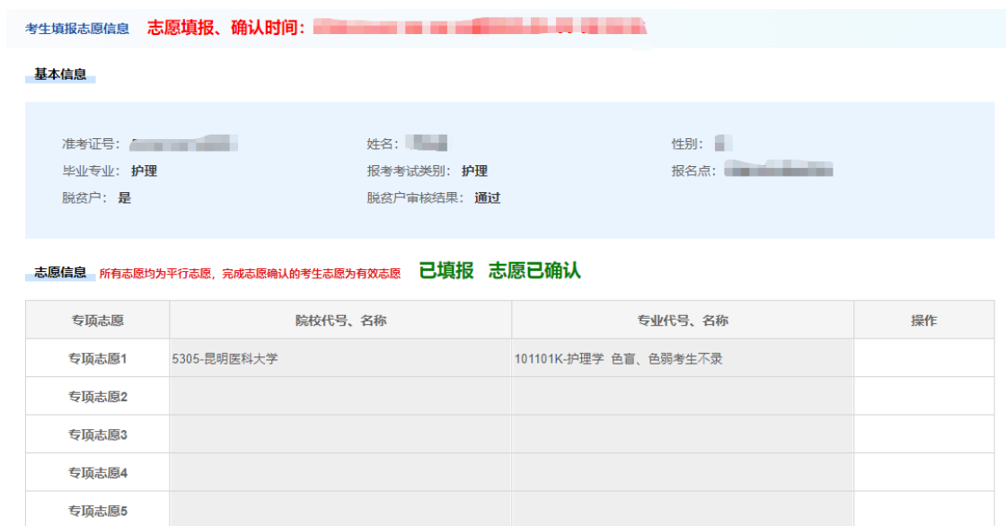
图 8 志愿已确认页面