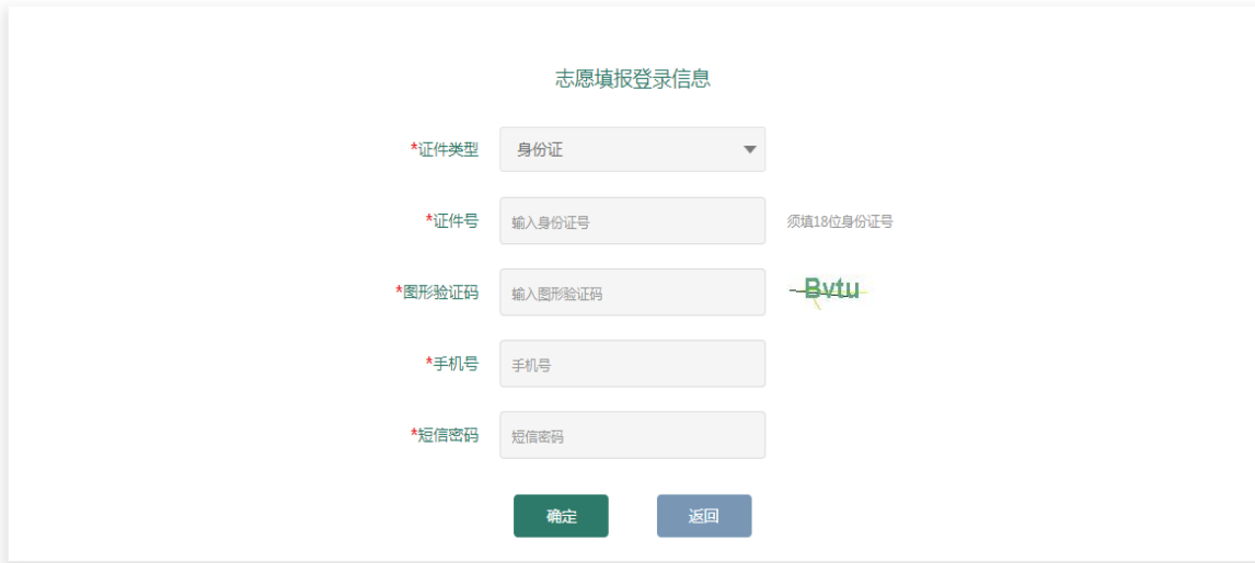
图 2 登录页面